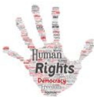
Violations des droits